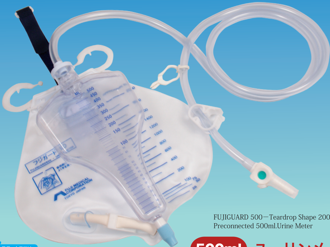
FUJIGUARD 500—Teardrop Shape 2000ml.Bag with Preconnected 500ml.Urine Meter