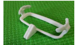
GE 12L 用 長軸用/短軸用