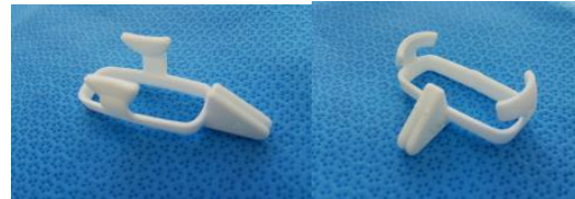
NanoMaxxL25 用 長軸用/短軸用