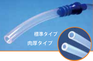
標準タイプ 肉厚タイプ