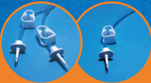
▲ P09413 【2way】 ▲ P09414 【1way】