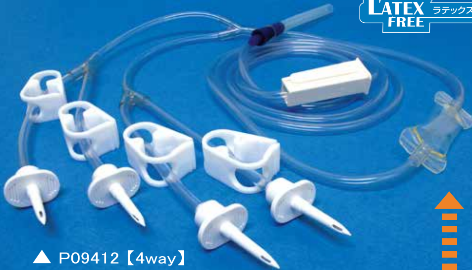
▲ P09412 【4way】