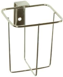
ワゴンブラケット 4401 1L