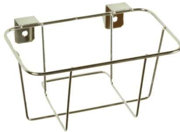
ワゴンブラケット 4402 2L,3L 兼用