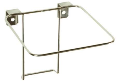
ワゴンブラケット 4403 4L,7L 兼用